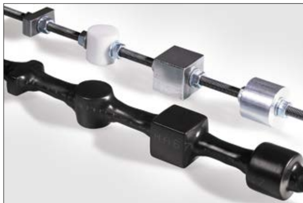
Tack vare den höga krympradien passar den för komplexa former och dimensioner.