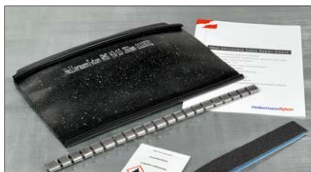
Zestaw RMS: oplot, stalowa klamra, pasek materiału ściernego, środek czyszczący, instrukcja.