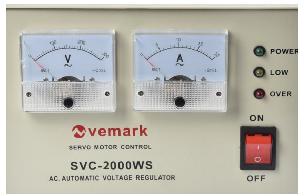
Фигура 3 – Общ изглед на стабилизаторите на напрежение от серията SVC-V – преден панел

Us- Горна граница на максимално допустимо входно напрежение