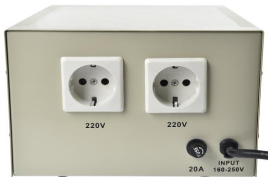
Фигура 4 – Общ изглед на стабилизаторите на напрежение от серията SVC-V – заден панел