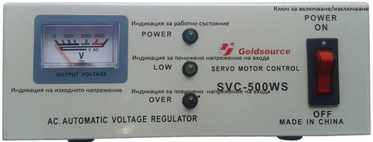
Фигура 3 – Общ изглед на стабилизаторите на напрежение от серията SVC-V – преден панел