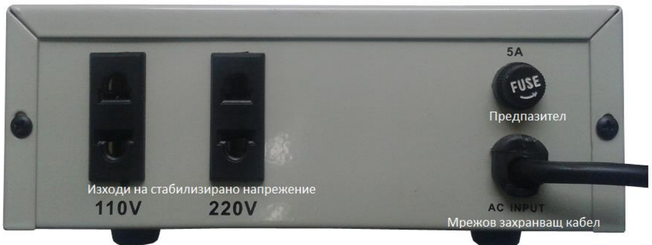
Фигура 4 – Общ изглед на стабилизаторите на напрежение от серията SVC-V – заден панел